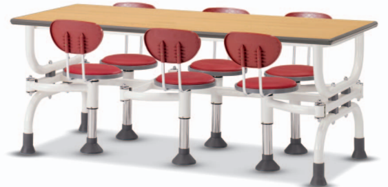
HOA8 W1800XD750XH730 G2B 22175820 ₩ 528,000