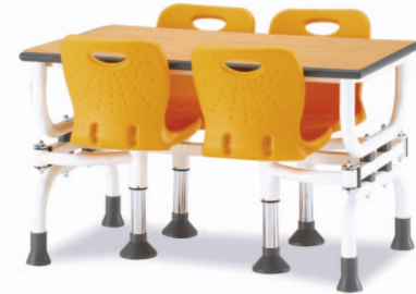
HOA4-1 W1200XD750XH730 G2B 22652210 ₩ 419,000