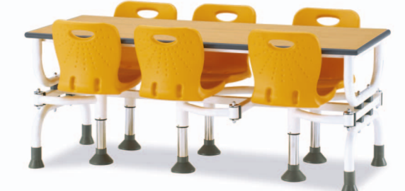
HOA8-1 W1800XD750XH730 G2B 22652212 ₩ 558,000