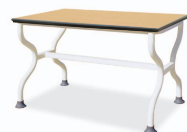
HANADT-204 W1200XD750XH730/680 G2B 21715880 ₩ 229,000