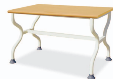
HANADT-104 W1200XD750XH730/680 G2B 21715878 ₩ 198,000