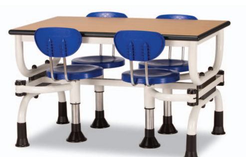
H4S W1200XD750XH730 G2B 22918754 ₩ 398,000