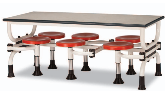
H6S W1800XD750XH730 G2B 22918751 ₩ 488,000