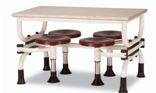
H1S W1200XD750XH730 G2B 22918756 ₩ 345,000