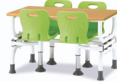
HOA3-1 W1200XD750XH730 G2B 22652209 ₩ 389,000