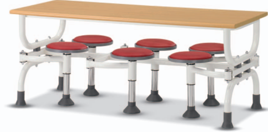
HOA5 W1800XD750XH730 G2B 22175822 ₩ 429,000