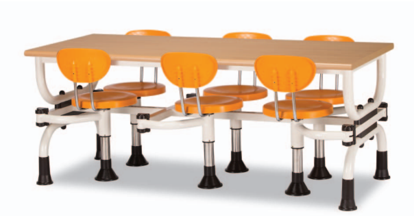
H7S W1800XD750XH730 G2B 22918750 ₩ 489,000