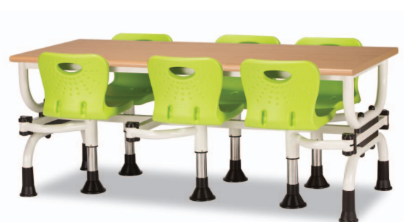
H11S W1800XD750XH730 G2B 22918745 ₩ 528,000