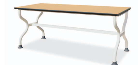
HANADT-206 W1800XD750XH730/680 G2B 21715879 ₩ 299,000