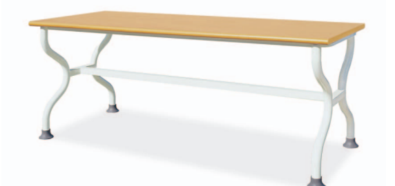
HANADT-106 W1800XD750XH730/680 G2B 21715881 ₩ 246,000