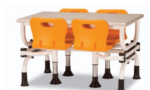
H9S W1200XD750XH730 G2B 22918748 ₩ 396,000