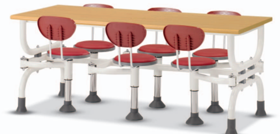
HOA7 W1800XD750XH730 G2B 22175819 ₩ 455,000