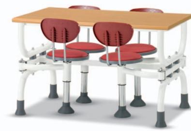
HOA3 W1200XD750XH730 G2B 22175816 ₩ 349,000