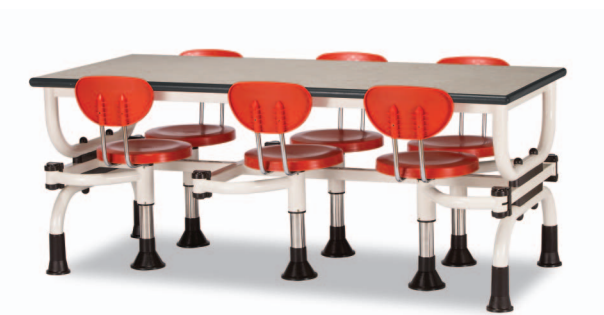
H8S W1800XD750XH730 G2B 22918749 ₩ 538,000