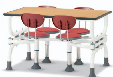
HOA4 W1200XD750XH730 G2B 22175817 ₩ 387,000