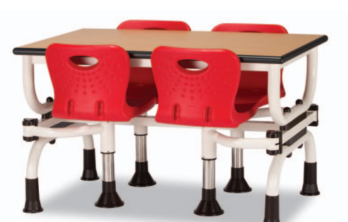
H10S W1200XD750XH730 G2B 22918746 ₩ 429,000