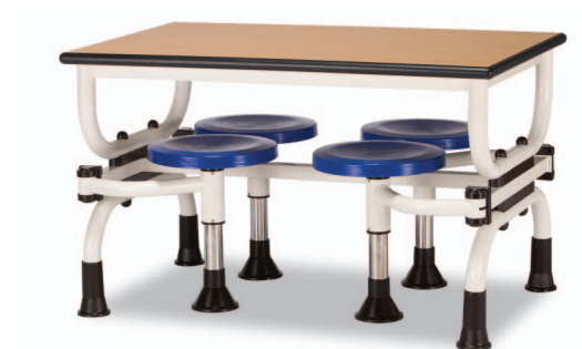
H2S W1200XD750XH730 G2B 22918755 ₩ 378,000