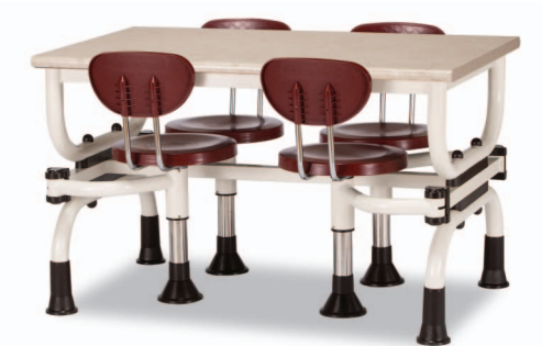
H3S W1200XD750XH730 G2B 22918753 ₩ 366,000