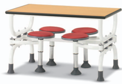
HOA2 W1200XD750XH730 G2B 22175815 ₩ 358,000