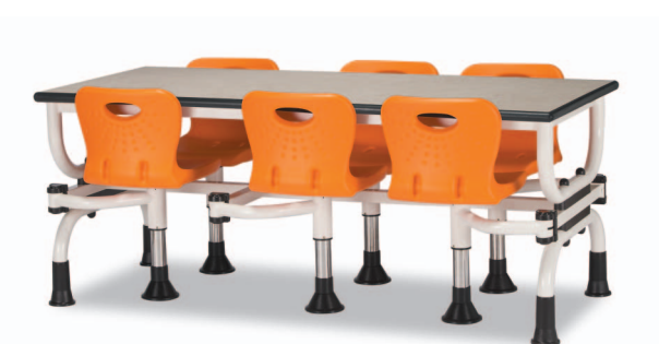
H12S W1800XD750XH730 G2B 22918747 ₩ 568,000