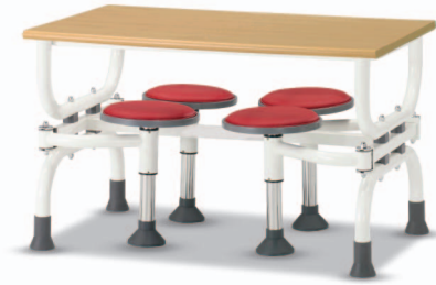
HOA1 W1200XD750XH730 G2B 22175814 ₩ 325,000