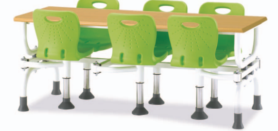
HOA7-1 W1800XD750XH730 G2B 22652211 ₩ 495,000